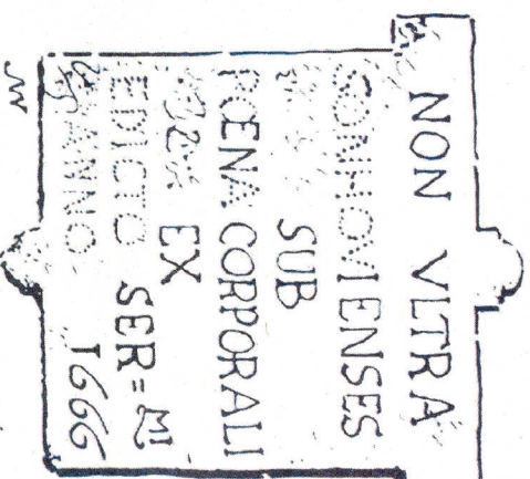
Reconstruictetekening van de uitdagende tekst aan het adres van de Zonhovenaars op de Paalsteen: tot hier en niet verder!

Tussen 1811 en 1822 werkten de kadastrale administraties van de Franse bezetter en vanaf 1815 van het Verenigd Koninkrijk der Nederlanden de precieze afbakening van de gemeentegrenzen uit. Niet