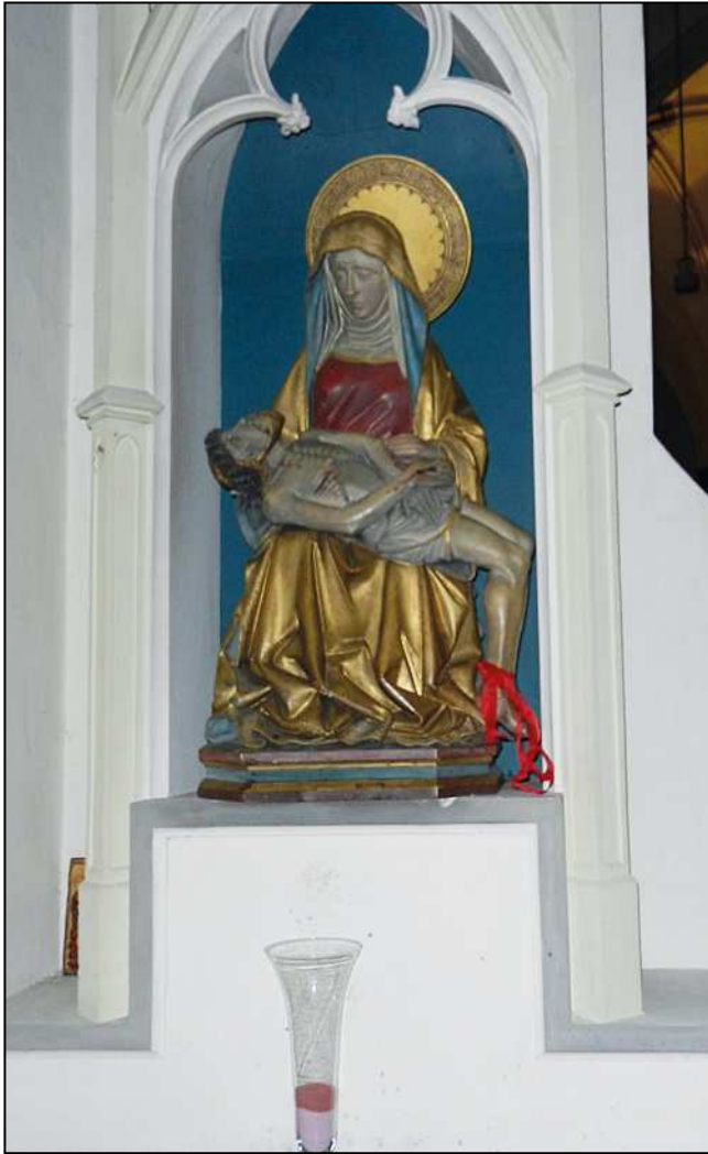
Pieta St-Quintinus, 19-02-2012.

andere , even oude Hasseltse kerkgangers hebben er niet de minste weet van. In religieuze volksculturele praktijken weten de linker- en de rechterhand niet van elkaar. Het laatste lintje hing er in februari 2012. Misschien zal ik u ooit van het laatste lapje textiel aan de voddenskapel kunnen vertellen.